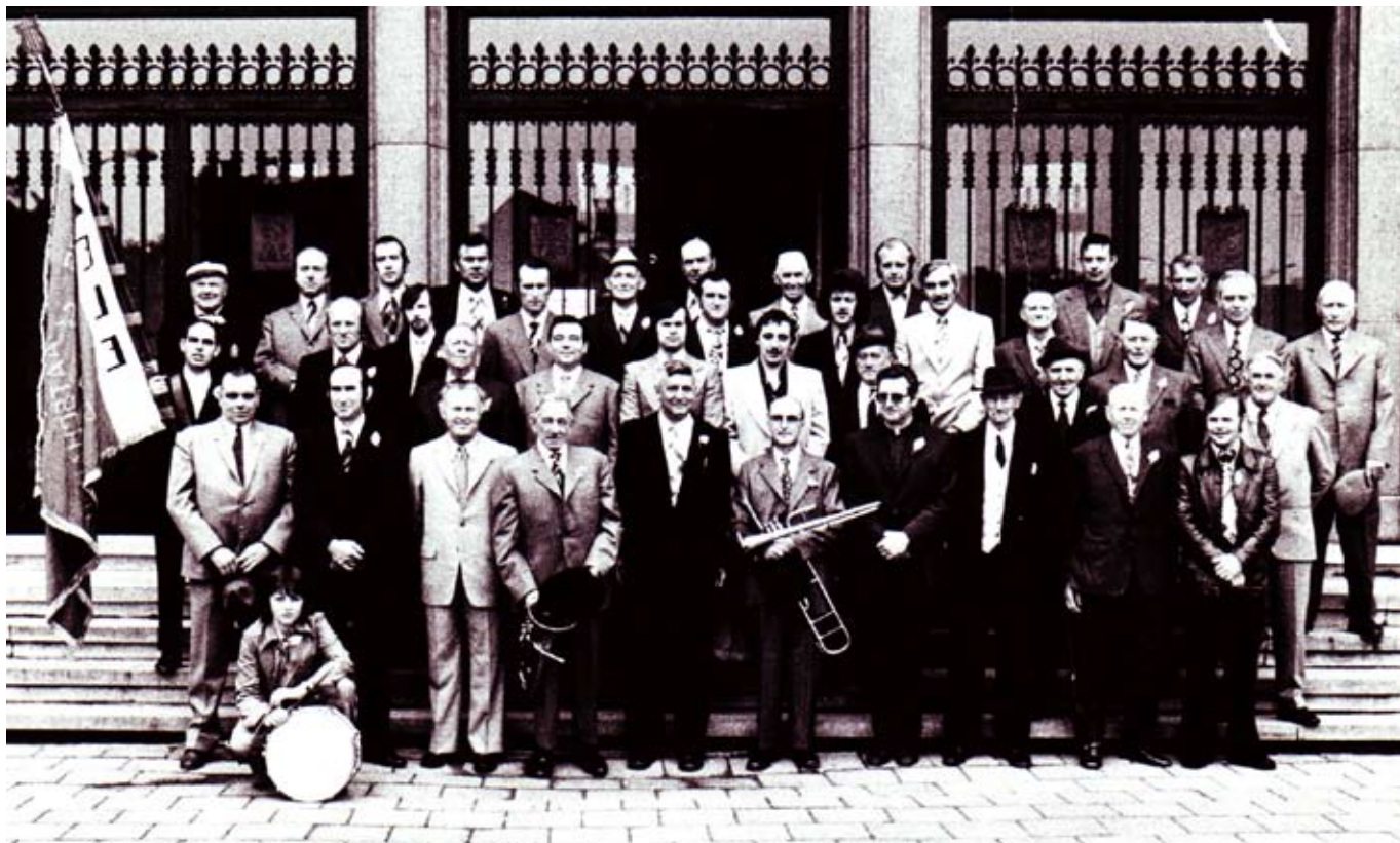
Ontvangst op het gemeentehuis voor het 100-jarig jubileum in 1975