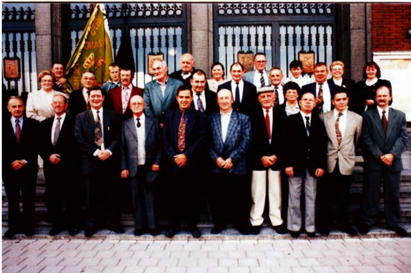
Ontvangst op het gemeentehuis : 125 jaar Vlamingen Vooruit in 2000

Naast hun optredens zijn er drie vaste activiteiten: de meizang, hun mosselsouper en last but not least hun Cecilia. Zowel de meizang als het mosselsouper brengt een aardige duit in het zakje. Geld dat enerzijds dient om de werking te verzekeren maar anderzijds willen ze ook het geld besteden aan een goed doel. Zo ging er al geld naar Ziekenzorg en het Sint-Niklaasfonds van de wijk voor de aankoop van een nieuwe outfit voor de Sint en zijn pieten.