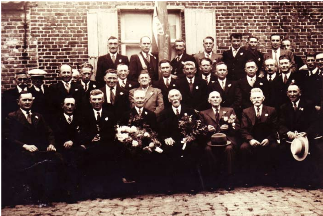
Het 75-jarig jubileum in 1950

wapenfeiten uit de geschiedenis optredens op de wereldtentoonstelling van Antwerpen in 1930 en deze van Brussel in 1935 en 1958.